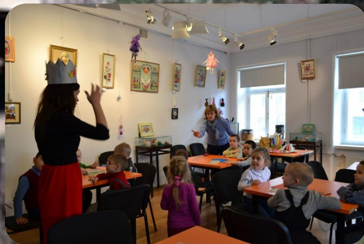
МАСТЕР-КЛАСС «СКАЗКИ В ПЛЯШНОЙ КОРОБКЕ»